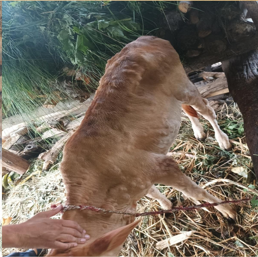
lumpy skin disease